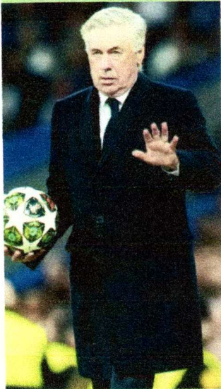
Italiano Carlo Ancelotti